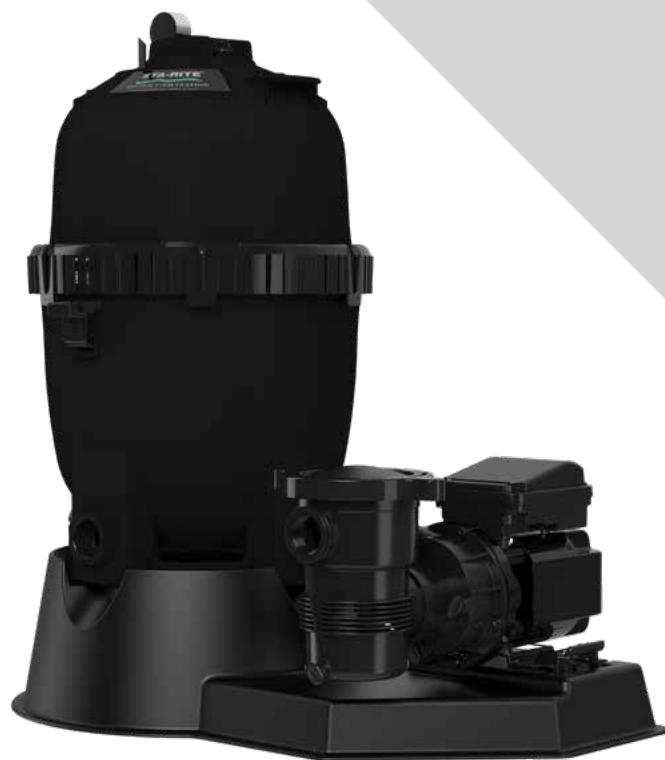
▲ SYSTÈME MODULAIRE TD DE SÉRIE PLD POUR PISCINE HORS TERRE

Les avantages sont clairs et nets. Profitez des avantages évidents d'un système modulaire TD de série PLD.