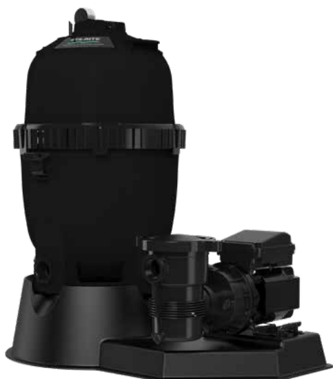
SYSTEM:2 MOD MEDIA SYSTÈMES HORS TERRE DE SÉRIE PLM